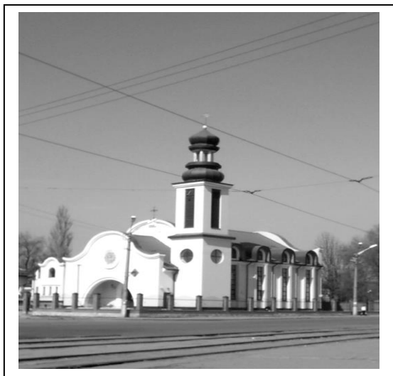
Римо-Католицька Церква Невського

В районі кільця Косіору є пам'ятник „Катюша”, музей „Трудової та бойової слави комбінату Криворіжсталь”. Готель „Домашній затишок”, спортивний комплекс „Локомотив”, футбольне поле, Римсько-католицька церква розташовані в районі Дружби. Сквер, пам'ятний знак „Паровоз”, готель „Вікторія” зосереджені в районі Залізничного вокзалу. У парку „Залізничний” розташований пам'ятник В.І. Леніну та меморіал присвячений загиблим у Великій Вітчизняній війні. Неподалік вокзалу Кривий Ріг – Головний розташована церква Олександра Невського по вул. Серафимовича.